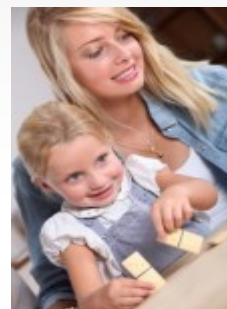
Garde et/ou accompagne- ment d'enfants