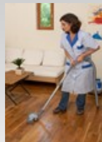
ENTRETIEN DE LA MAISON ET TRAVAUX MENAGERS