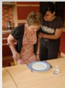
PREPARATION DES REPAS

Toute intervention réalisée un dimanche, jour férié ou de nuit sera majorée.